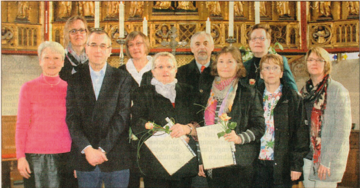
Die neuen Hospizbegleiter der Hospizgruppe Leinebergland erhalten Gottes Segen und stellen ihre Arbeit anschließend in direkten Gesprächen vor. ■ Foto: Zimmer