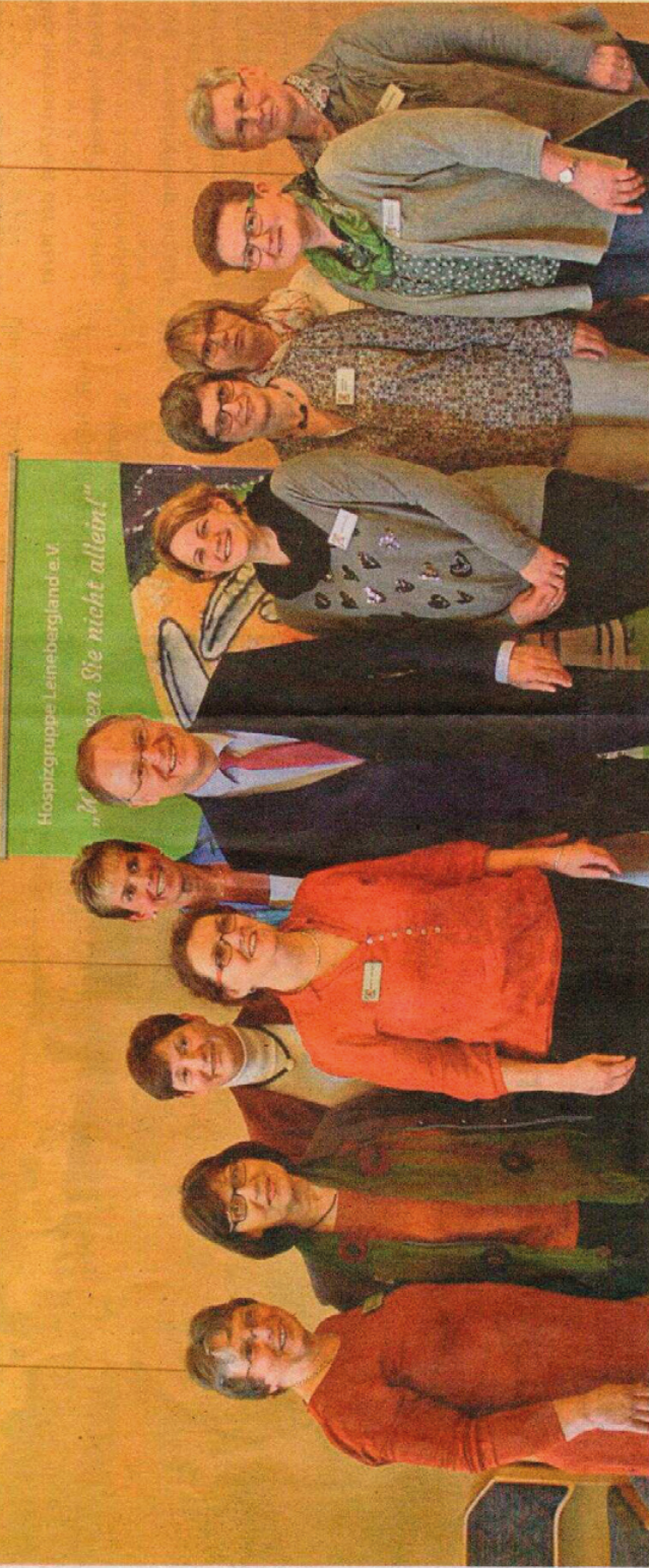
Der Niedersächsische Ministerpräsident Stephan Weil und Mitglieder der Hospizgruppe Leinebergland bei ihrem Treffen im Lutherhaus in Alfeld.

Ministerpräsident informiert sich bei Hospizgruppe Leinebergland über Sterbe- und Trauerbegleitung