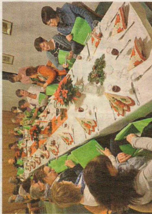
Hospizler freuen sich über die neuen Taschen.

Spendenaktion beschenkt Aktive der Hospizgruppe Leinebergland